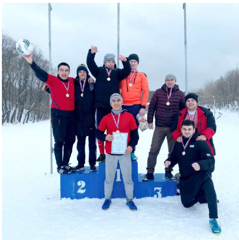
Команда победителей по мини-футболу на снегу из Перелюба