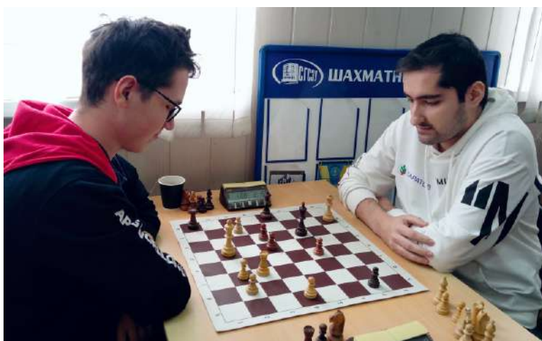
На шахматном турнире

Площадкой для шахматного турнира в рамках спартакиады стал шахматный