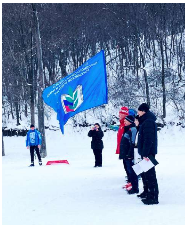
На открытии профсоюзной лыжни – 2023

Так выпало, что X спартакиада Саратовского областного профсоюза работников образования проходила первой после вынужденной «удаленки» во время пандемии. Два года любители зимних видов спорта со всех уголков области не могли встретиться по санитарным условиям, состязались на местах, а данные передавали в оргкомитет обкома профсоюза. И вот теперь праздник возобновил свои традиции. А мы решили событие 2023 года не откладывать до следующего выпуска журнала, осветить его по свежим следам. Поэтому